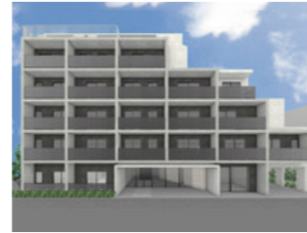
豊玉上レジデンス(仮称)

LOCATION 東京都品川区南大井 COMPLETION 2025年9月予定 SPECS RC造/7F FLOOR AREA 534㎡