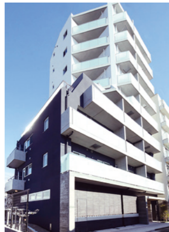
GRAN PASEO 浜田山 2018年1月

LOCATION 東京都目黒区南 SPECS RC造/10F FLOOR AREA 703㎡