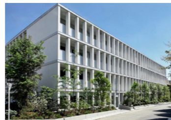
THE GRAND TERRACE 若林

LOCATION 東京都世田谷区北沢 COMPLETION 2024年7月 SPECS RC造/5F・B1F FLOOR AREA 524㎡