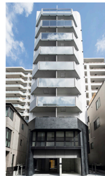
GRAN CASA 門前仲町

LOCATION 東京都練馬区豊玉北 COMPLETION 2020年12月 SPECS RC造/8F FLOOR AREA 716㎡