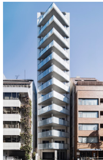
MYRIA RESIDENCE 新宿御苑II

LOCATION 東京都大田区中馬込 COMPLETION 2021年6月 SPECS RC造/7F FLOOR AREA 823㎡