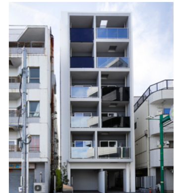
MYRIA RESIDENCE 長原

LOCATION 東京都台東区元浅草 COMPLETION 2025年12月予定 SPECS RC造/9F FLOOR AREA 793㎡