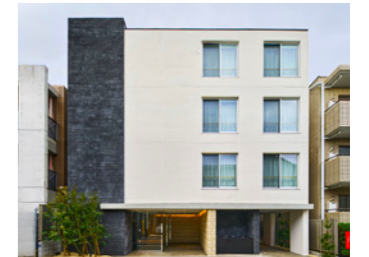
THE RIDGE 馬込貴船坂

LOCATION 東京都大田区南蒲田 COMPLETION 2023年11月 SPECS RC造/5F FLOOR AREA 566㎡