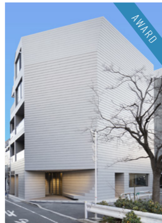
THE CON-TOUR 旗の台 2024年1月

LOCATION 東京都杉並区浜田山 SPECS RC造/9F FLOOR AREA 917㎡