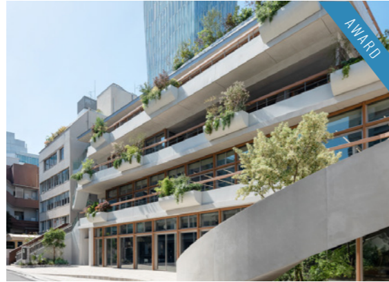
SPRING TERRACE 表参道 2020年9月

LOCATION 東京都港区北青山 SPECS RC造/4F FLOOR AREA 1,670㎡