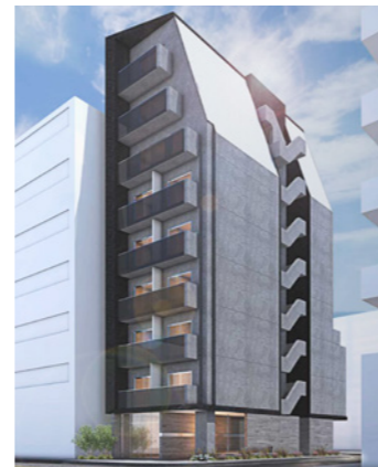
西新宿レジデンス(仮称)

LOCATION 東京都世田谷区等々カ COMPLETION 2019年3月 SPECS S造/3F FLOOR AREA 404㎡