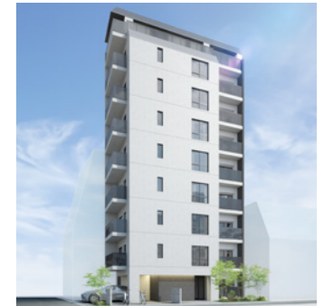
元浅草レジデンス(仮称)

LOCATION 東京都大田区南馬込 COMPLETION 2022年11月 SPECS RC造/4F FLOOR AREA 656㎡