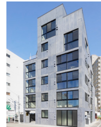
SOLID BLUE 門前仲町

LOCATION 東京都新宿区河田町 COMPLETION 2018年7月 SPECS RC造/6F・B1F FLOOR AREA 771㎡