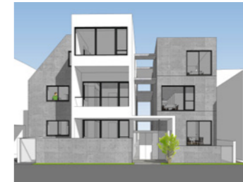
元浅草レジデンス(仮称)

LOCATION 東京都江東区古石場 COMPLETION 2020年12月 SPECS RC造/6F FLOOR AREA 530㎡