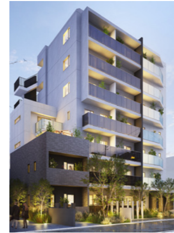
馬込レジデンスIII(仮称)

LOCATION 東京都中野区弥生町 COMPLETION 2025年8月予定 SPECS RC造/9F FLOOR AREA 932㎡