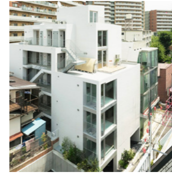
THE DENS 曙橋

LOCATION 東京都江東区東陽 COMPLETION 2019年4月 SPECS RC造/5F・B1F FLOOR AREA 601㎡