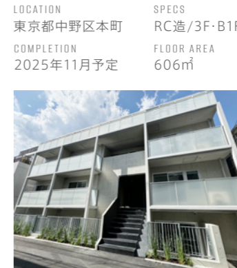
中野坂上レジデンス(仮称)

LOCATION 東京都台東区元浅草 COMPLETION 2025年12月予定 SPECS RC造/9F FLOOR AREA 793㎡