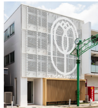
等々カプロジェクト(仮称)

LOCATION 東京都練馬区豊玉北 COMPLETION 2025年5月予定 SPECS RC造/6F・B1F FLOOR AREA 1,476㎡