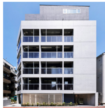
GRAN CASA 馬込

LOCATION 東京都世田谷区若林 COMPLETION 2024年5月 SPECS RC造/4F FLOOR AREA 2,862㎡