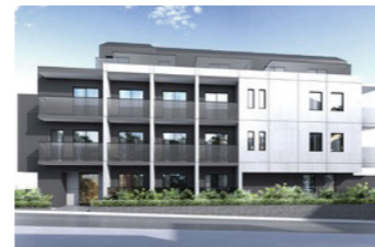
豊玉北レジデンスII(仮称)

LOCATION 東京都練馬区豊玉上 COMPLETION 2025年8月予定 SPECS RC造/6F・B1F FLOOR AREA 1,900㎡