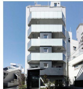
THE COTEAU 新中野

LOCATION 東京都世田谷区三宿 COMPLETION 2015年3月 SPECS RC造/5F・B1F FLOOR AREA 1,162㎡