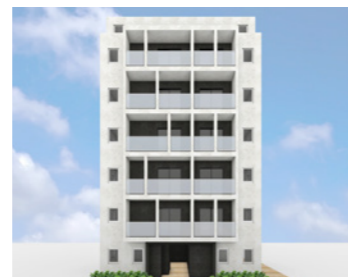
南大井レジデンス(仮称)

LOCATION 東京都大田区中馬込 COMPLETION 2020年6月 SPECS RC造/7F FLOOR AREA 785㎡