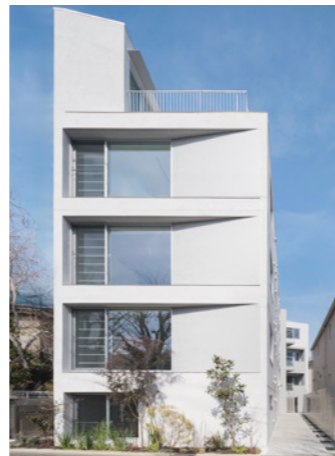
REMBRAN 赤堤 2024年2月

LOCATION 東京都世田谷区赤堤 SPECS RC造/4F FLOOR AREA 718㎡