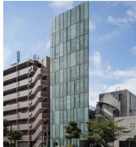
TIME SHARING 大岡山 2021年9月

LOCATION 東京都目黒区南 SPECS RC造/10F FLOOR AREA 703㎡