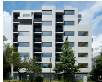
GRAND CASA 馬込II

LOCATION 東京都中野区本町 COMPLETION 2024年3月 SPECS RC造/8F FLOOR AREA 464㎡