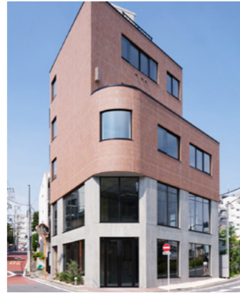
下北 PARK FRONT

LOCATION 東京都新宿区四谷 COMPLETION 2023年2月 SPECS RC造/13F FLOOR AREA 927㎡