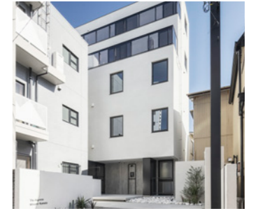
THE AIGRETTE 南蒲田

LOCATION 東京都中野区本町 COMPLETION 2025年11月予定 SPECS RC造/3F・B1F FLOOR AREA 606㎡